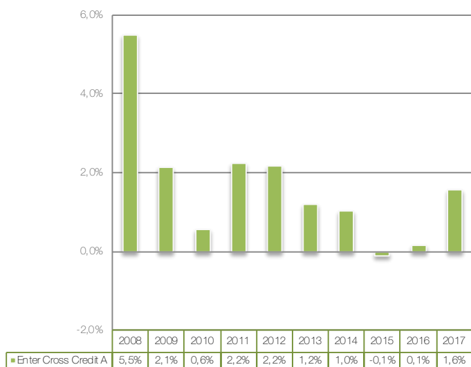
■ Enter Cross Credit A

Fondens resultat (avkastning) är beräknat efter avdrag för årlig avgift. Värdet för samtliga år är beräknat i svenska kronor och med tidigare utdelningar återinvesterade i fonden.